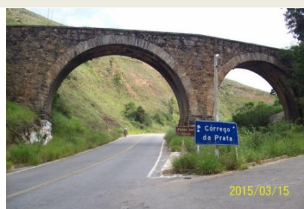
O imponente viaduto dos Arcos (1883)