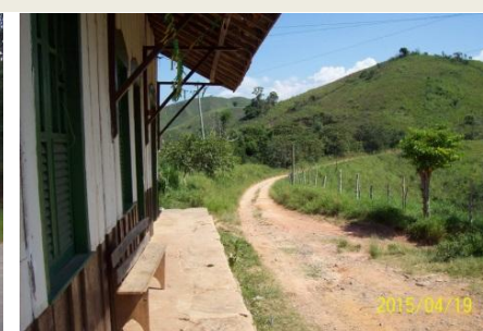
Estação Leite de Sousa (km 307,3)