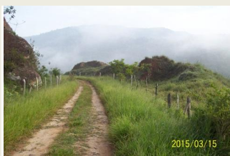
Antigo leito, fácil de rodar de carro

Partindo-se de Conservatória (Km 331,6) é possível se fazer um belo passeio de carro de 31 km pelo antigo leito até S ta . Isabel do Rio Preto (km 300,6) na divisa com Minas. Abaixo algumas fotos da nossa visita recente ao local.