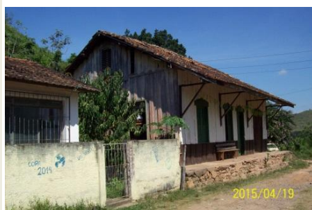
Est. Leite de Sousa virou moradia