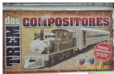
Domingo tem chorinho na praça

Partindo-se de Conservatória (Km 331,6) é possível se fazer um belo passeio de carro de 31 km pelo antigo leito até S ta . Isabel do Rio Preto (km 300,6) na divisa com Minas. Abaixo algumas fotos da nossa visita recente ao local.