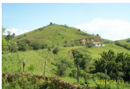
Lindo trecho após Leite de Sousa