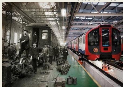
Passado & Presente