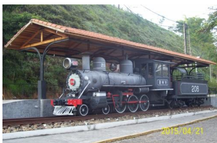
A loco 206 preservada em Conservatória