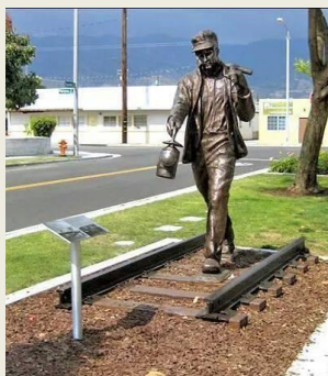
O Guarda-linhas (EUA)