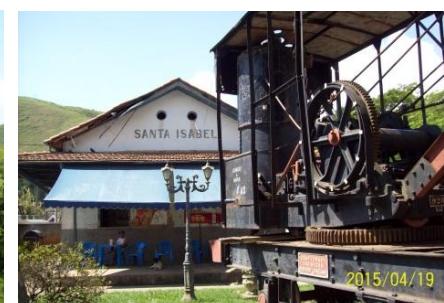
Sta. Isabel do Rio Preto (km 300,6)